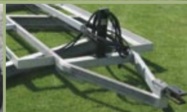
Kraftigt og fleksibelt træk.