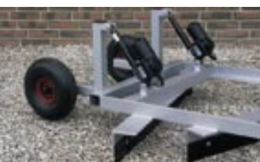
Støtthjul til gradhældning, mekanisk eller med el- actuatorer.