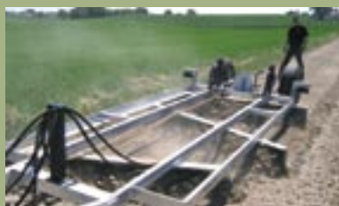
Mammen vejhøvl skærer sig igennem materialet.