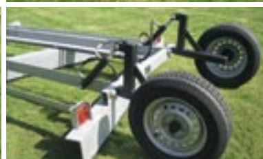
Hydraulisk gradhældning betjenes nemt fra traktoren.