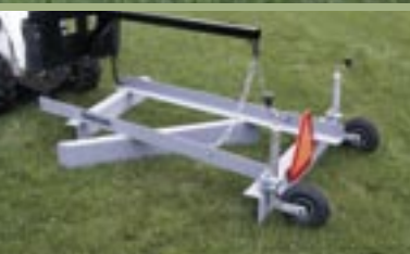
Med kæder monteres vejhøvlen i løftearmene på en minilæsser.

Mammen vejhøvl model M 1 GL er liftophængt og model M 1 GLF er til frontmontering på minilæsser. Begge modeller har en arbejdsbredde på 1,6 m. Modellen til minilæsser monteres i løftearmene med kæder og trækkes igennem materialet. Den liftophængte model er specielt fremstillet til mindre traktorer med begrænset liftkapacitet. De manuelt betjente hjul gør det let at lave profil på vejen.