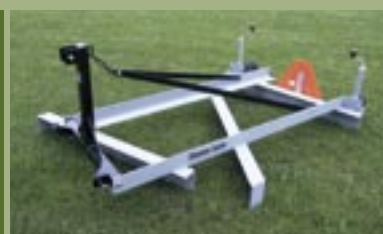
Bevægeligt tårn så høvlen følger terrænet.