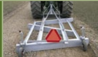
Hjul til gradhældning så man let laver profil på vejen.