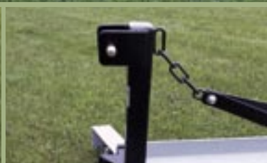
Passer til mindre traktorer med kat. 1 lift.