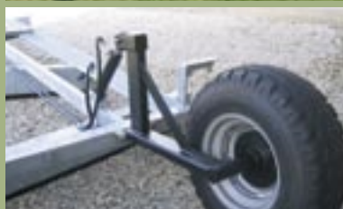
Kraftigt hjulophæng med dobbeltvirkende løftecylinder.