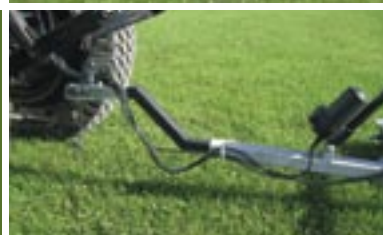
Hurtig og nem tilkobling af vejhøvlen.