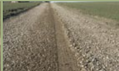
Efter kørsel med Mammen vejhøvl.