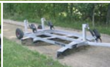
Masser af ekstraudstyr til kørsel med ATV motorcykel og have- og park traktor.