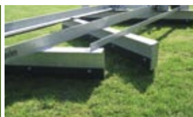
De tre Hardox stålskær sikrer lang levetid og et effektivt arbejde.