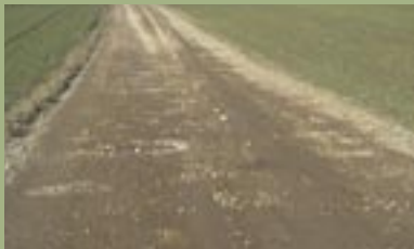
Før kørsel med Mammen vejhøvl.

Mammen vejhøvl model M 3 GL er liftophængt og egner sig til mellemstore opgaver. Bredden på 2,15 m. gør vejhøvlen alsidig til grusveje og -arealer. De tre skær gør, sammen med det bevægelige tårn, vejhøvlen effektiv selv ved kun en gangs kørsel. De manuelt betjente hjul gør det let at lave profil på vejen.