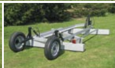
Alle modeller er galvaniseret, det sikrer lang levetid.